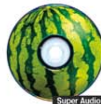
Super Audio CD